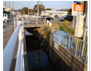
鴨生地区水害対策

過去何度も水害にあっている鴨生地区の対策として、鴨生地区のゲート拡幅工事。鴨生調整池導水路設置工事。鴨生調整池池面吹付工事などの予算を計上した。